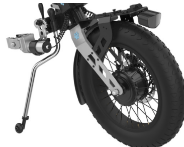
Tourer 20" Fat-Tires