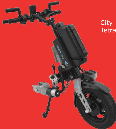
City 12" Autoclamp, Tetra-Brake