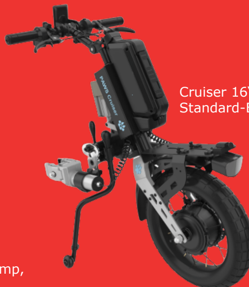
Cruiser 16" , Autoclamp, Standard-Brake