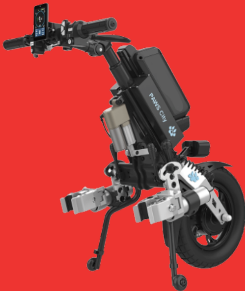
City 14" Autoclamp, Lift, Standard-Brake