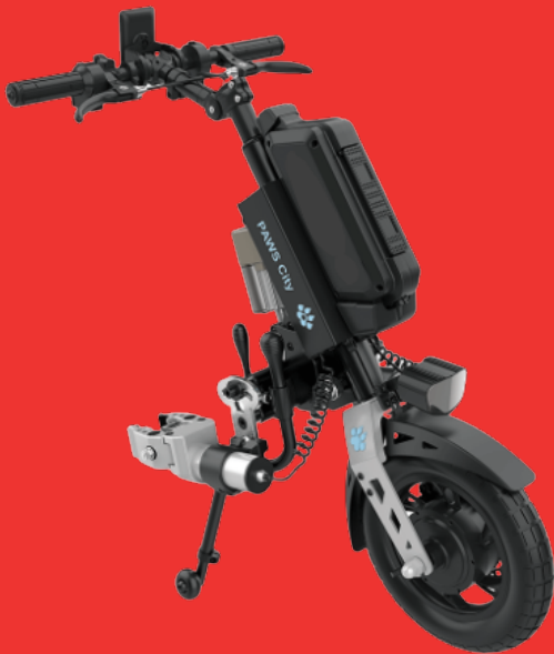
City 12" Autoclamp, Standard-Brake

Erstes patentiertes, vollautomatisches Fixierungssystem MIT automatischer Rollstuhl-Anhebung